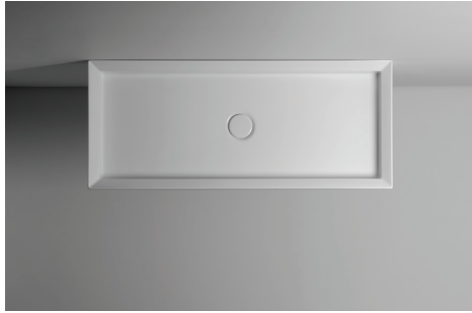
90 x 38 h12 tutta vasca