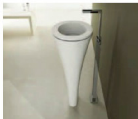
Sotto, il lavabo Amedeo di Ceramica Cielo , disegnato da Karim Rashid, qui nella versione a colonna. A destra, i sanitari Affetto Collection di Globo sono caratterizzati da un'unica superficie continua, dalla base alla sommità.

È vero, si cambia residenza molto più spesso che in passato. E con essa, spesso si cambia l'arredo. Il trend nell'ambiente bagno conferma l'esigenza di lavorare su soluzioni capaci invece di essere tra-