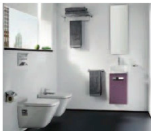
Sopra, compattezza e funzionalità sono le caratteristiche della collezione The Gap di Roca . In alto al centro, vaso e bidet della linea 500 , design Antonio Citterio con Sergio Brioschi per Pozzi-Ginori . Di fianco, sanitari e lavabo della linea Start di Monia Marzano per Valdama .