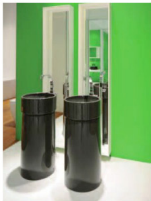
A sinistra, Twin Column , disegnato da Roberto e Ludovica Palomba per Flaminia .

Le proposte di autunno/inverno 2011-2012 della ceramica sanitaria italiana sono visibili su: www.laceramicaitaliana.it/prodotti